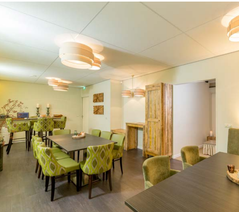
Familiekamer & Cateringruimte